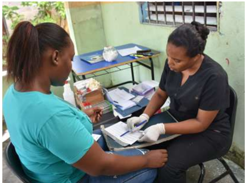
Las personas que son atendidas en la UMS de Profamilia, reciben información sobre los derechos y deberes de los usuarios, según el protocolo del MSP.