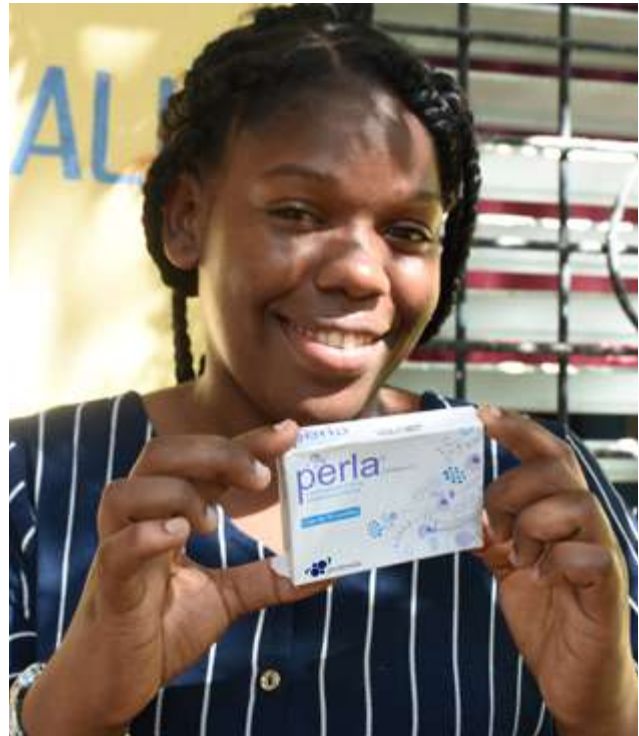
La Unidad Móvil de Salud (UMS) facilita el acceso a servicios y productos de salud reproductiva a población residente en zonas peri urbanas.

En el centro de contacto también se trabaja para mejorar el acceso de la población a información y para ello, mediante la inteligencia artificial (IA) se desarrolló un chatbot con la finalidad de que la población tenga acceso a información básica sobre los servicios y productos las 24 horas del día y -como prueba piloto- se instaló un teléfono directo al centro de contacto en el área de servicio al cliente de la clínica Evangelina Rodríguez, para que las personas usuarias puedan realizar su cita de seguimiento en el momento en que salen de su consulta.