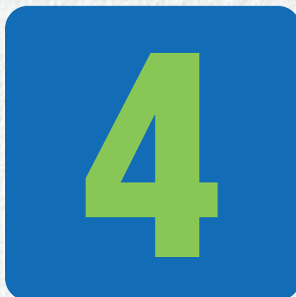
IMAGEN Y POSICIONAMIENTO INSTITUCIONAL